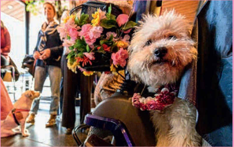
Dogparade 010 x Halloween Edition

Wat ooit begon als een pilot, is voor een groeiende groep Rotterdammers niet meer uit het centrum weg te denken; de Doelen Studio, het vrolijke podium voor heel Rotterdam.