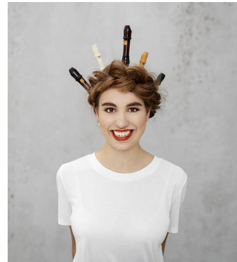
Lucie Horsch