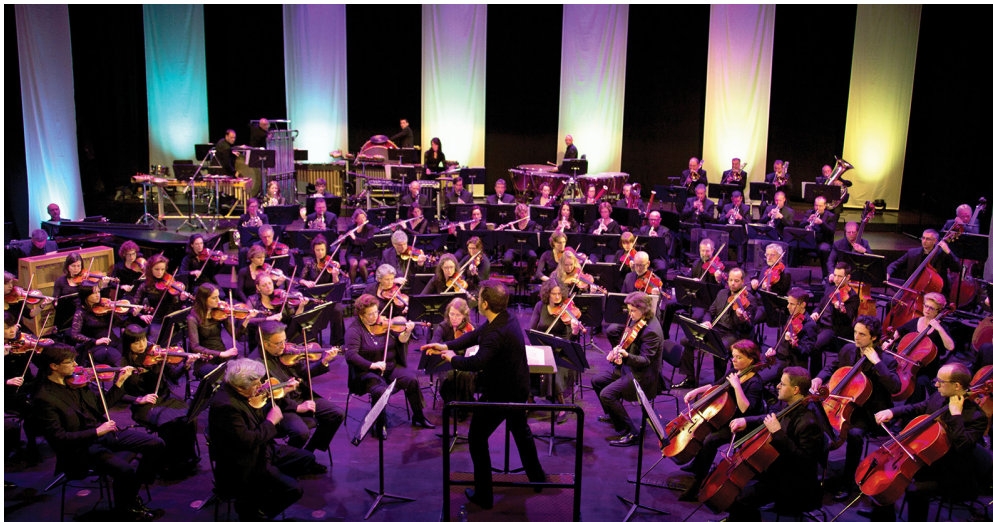
Residentie Orkest