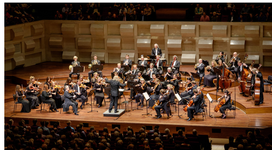
Sinfonia Rotterdam