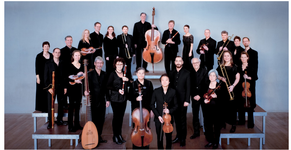
Nederlandse Bachvereniging