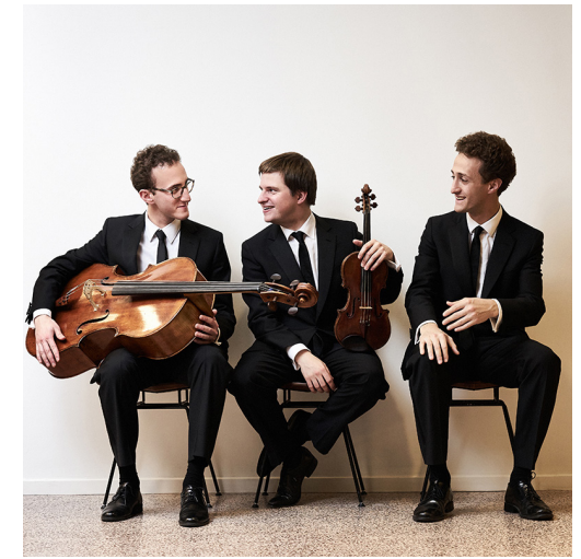
Busch Trio