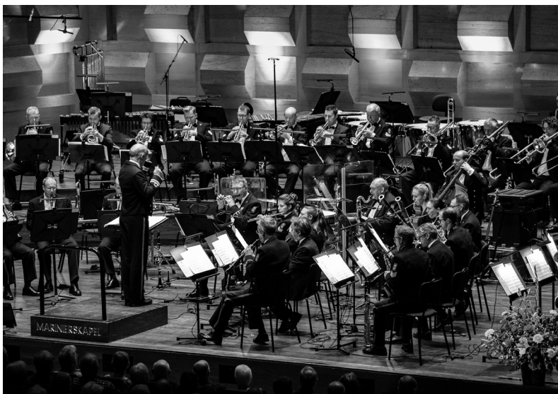
Marinierskapel der Koninklijke Marine