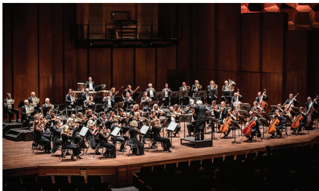
Noord Nederlands Orkest

Houd je in, scheppende kracht, Oergedachte, eeuwige macht! Adem rustig, beheers je drang, Zwijg een enkele seconde lang!