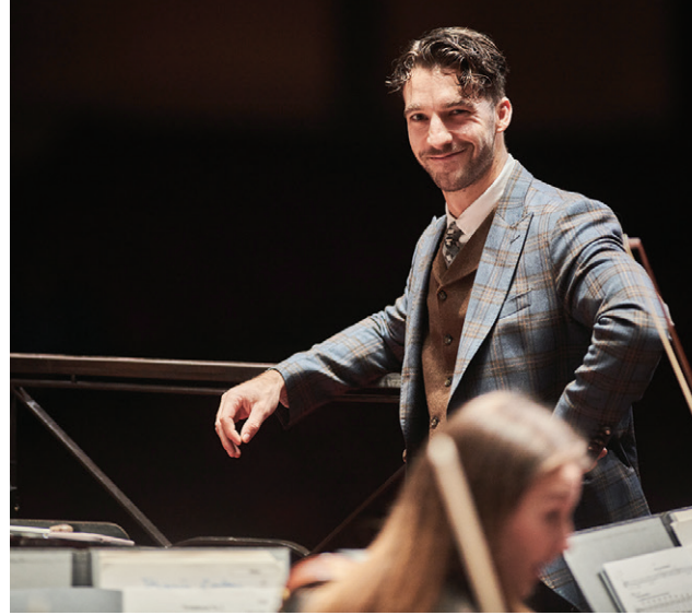
Lorenzo Viotti

De basis voor het Requiem vormt het eerder door Verdi gecomponeerde 'Libera me' voor de componist Gioachino Rossini. Toen Rossini in 1868 stierf stelde Verdi voor dat een aantal Italiaanse componisten samen een Requiem voor hem zouden schrijven. Dertien componisten werkten mee, maar de compositie werd tot groot verdriet van Verdi nooit uitgevoerd. Dit nieuwe Requiem gaf hem de kans het materiaal alsnog te gebruiken. Het Requiem is