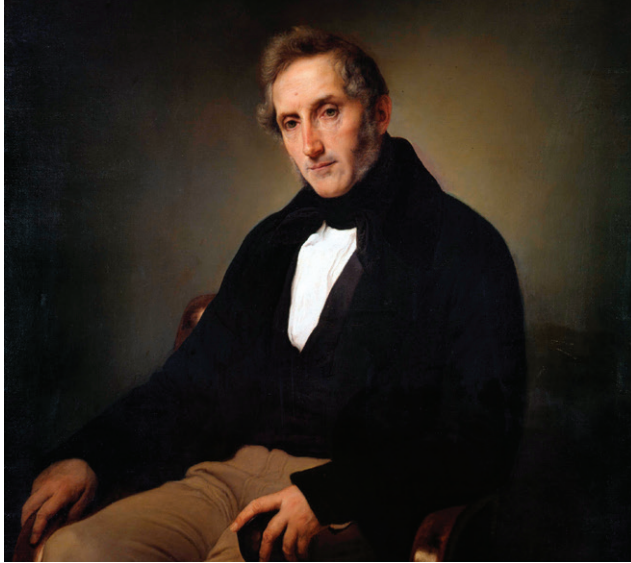
Alessandro Manzoni, geschilderd door Francesco Hayez

het behoort. Een heleboel woorden, maar werkelijk doorvoeld is er niet een.' Vastbesloten om zelf iets te schrijven wat Manzoni waardig was, wendde Verdi zich tot de burgemeester van Milaan met het aanbod een requiem te componeren. Het gemeentebestuur aanvaardde dit en Verdi ging vanuit zijn zomerverblijf in Parijs aan het werk.