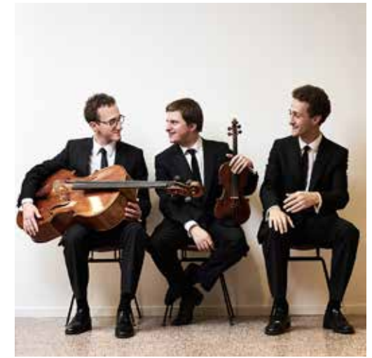
Busch Trio