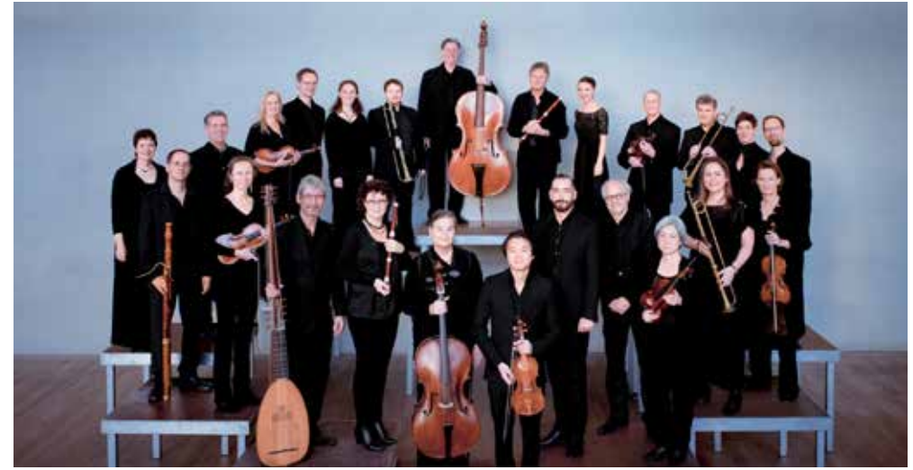
Nederlandse Bachvereniging © Simon van Boxtel