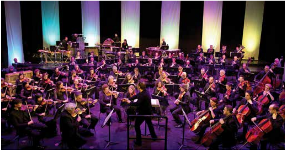
Residentie Orkest