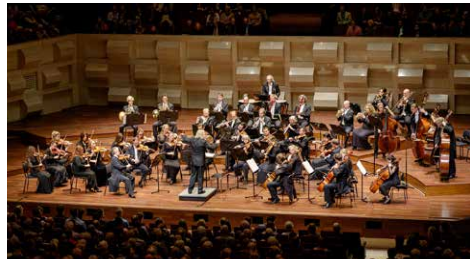
Sinfonia Rotterdam