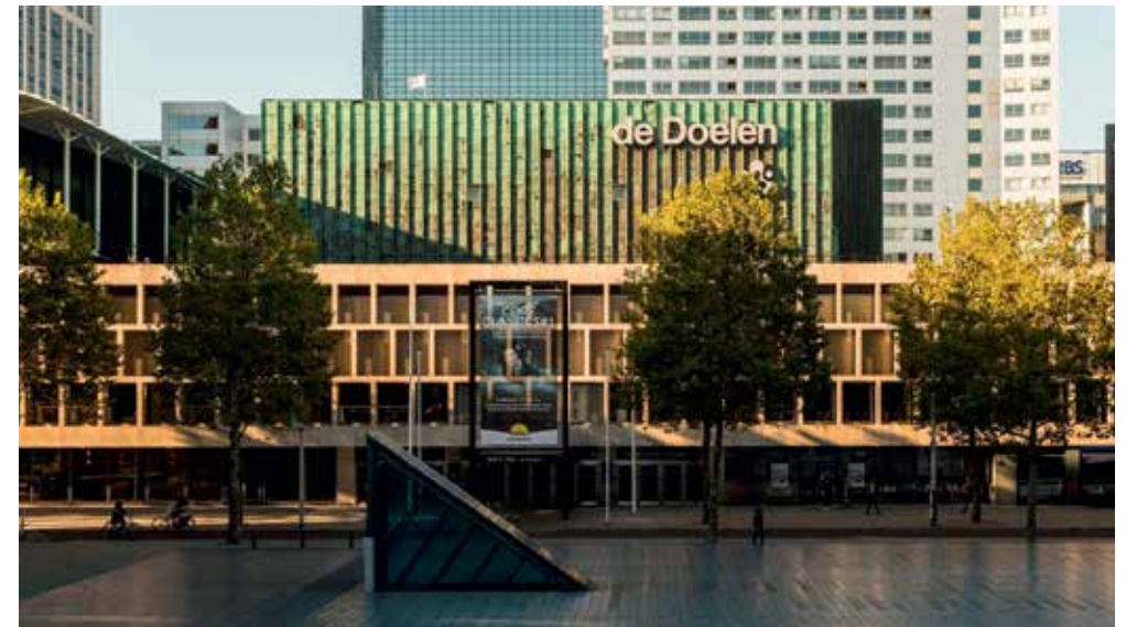
de Doelen