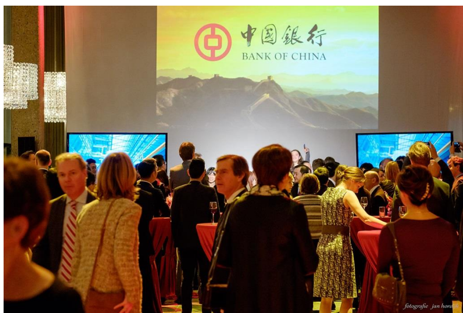
Sponsorontvangst Bank of China