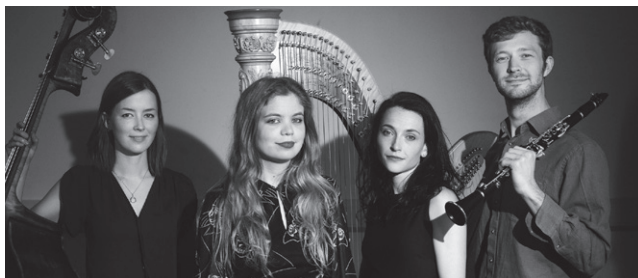
The Hermes Experiment