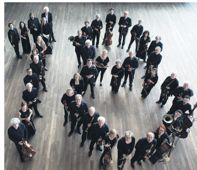
Orkest van de Achttiende Eeuw

fortepiano en klokkenspel Pieter-Jan Belder