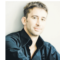
Henk Neven