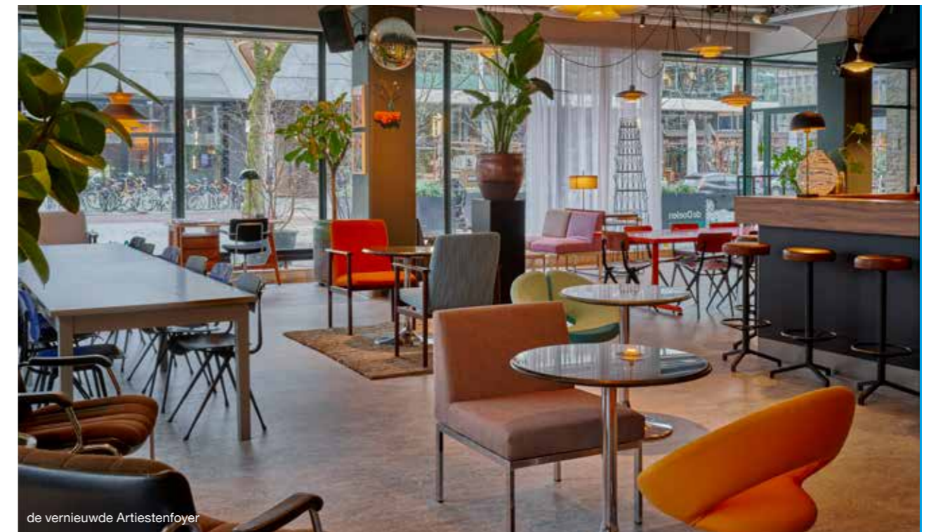
de vernieuwde Artiestenfoyer

In 2021 werd een bijdrage gegeven van 100.000 euro voor een upgrade van de Artiestenfoyer. Deze ruimte heeft een prachtige make-over gekregen en kan nu ook als publieke ruimte worden ingezet na concerten, voor talks, drinks en korte concertjes. Er werden garanties van 100.000 euro gegeven ten behoeve van de programmering van de eerste en tweede helft van 2022, zodat de Doelen programmeringsafspraken op de lange termijn kon maken, ook tijdens de coronapandemie. Tenslotte werd er 200.000 euro toegezegd ten behoeve van een te realiseren mediastudio, die we in kunnen zetten voor radio-, televisie- en muziekopnames in samenwerking met culturele, maatschappelijke en commerciële partners.