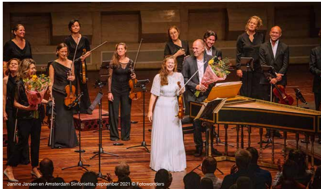
Janine Jansen en Amsterdam Sinfonietta, september 2021

Daarnaast gaven verschillende bedrijven een bijdrage ten behoeve van Stoelen voor de Doelen voor een totaalbedrag van € 98.600, welke bijdrage rechtstreeks naar de Doelen is gegaan.