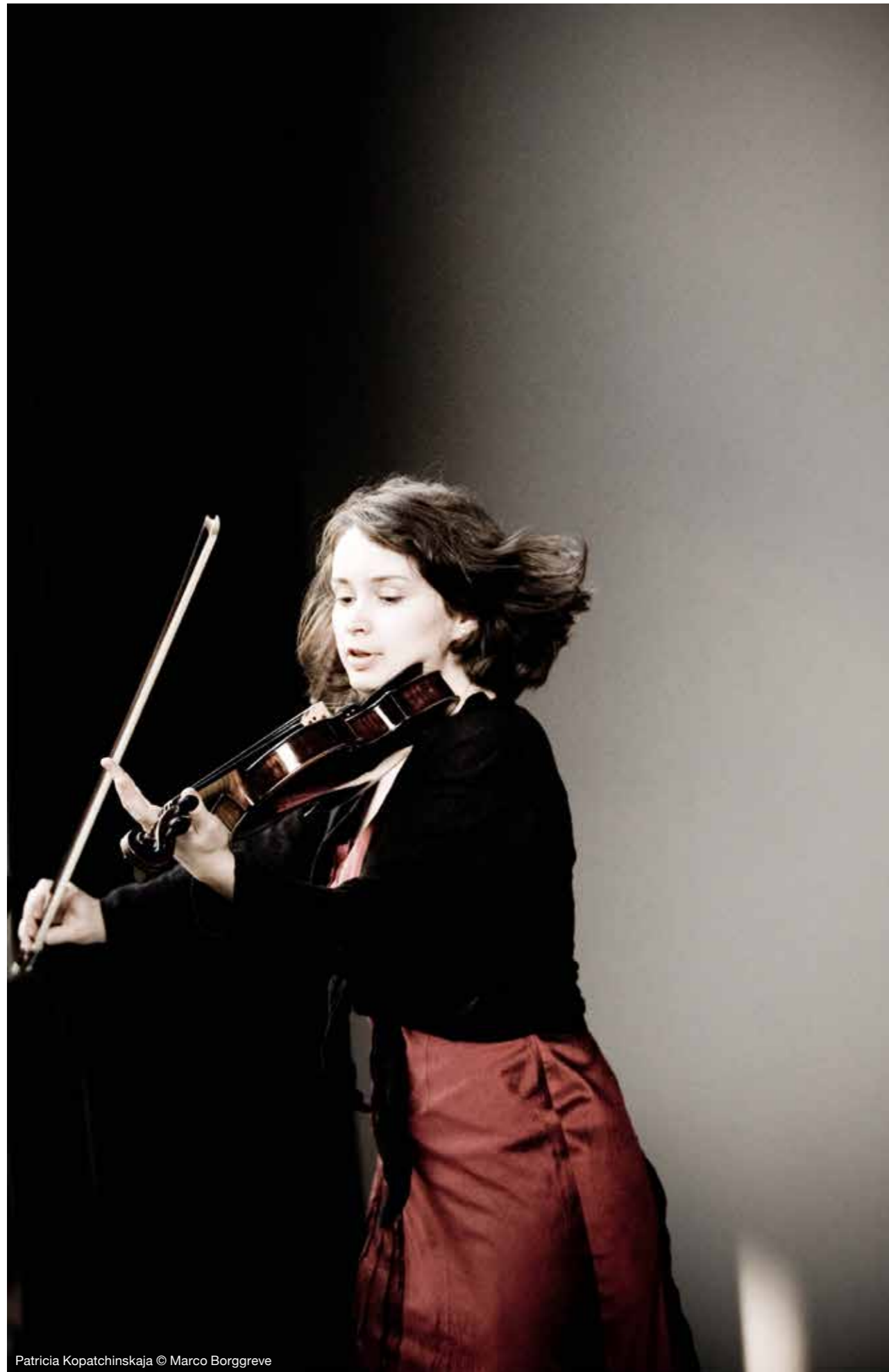
Patricia Kopatchinskaja