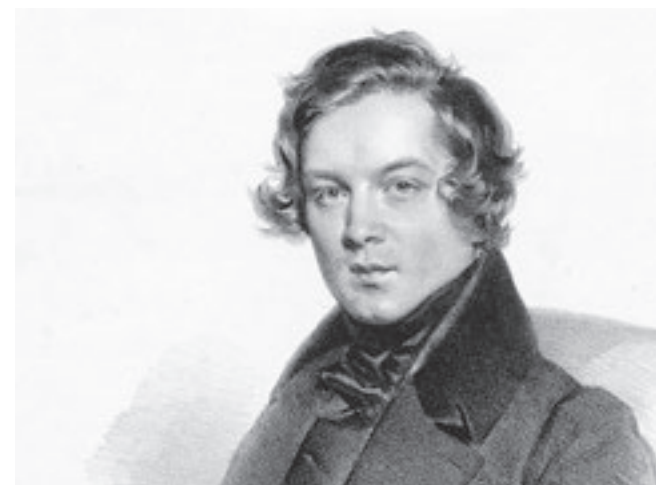
Robert Schumann, geschilderd in 1839 door Josef Kriehuber