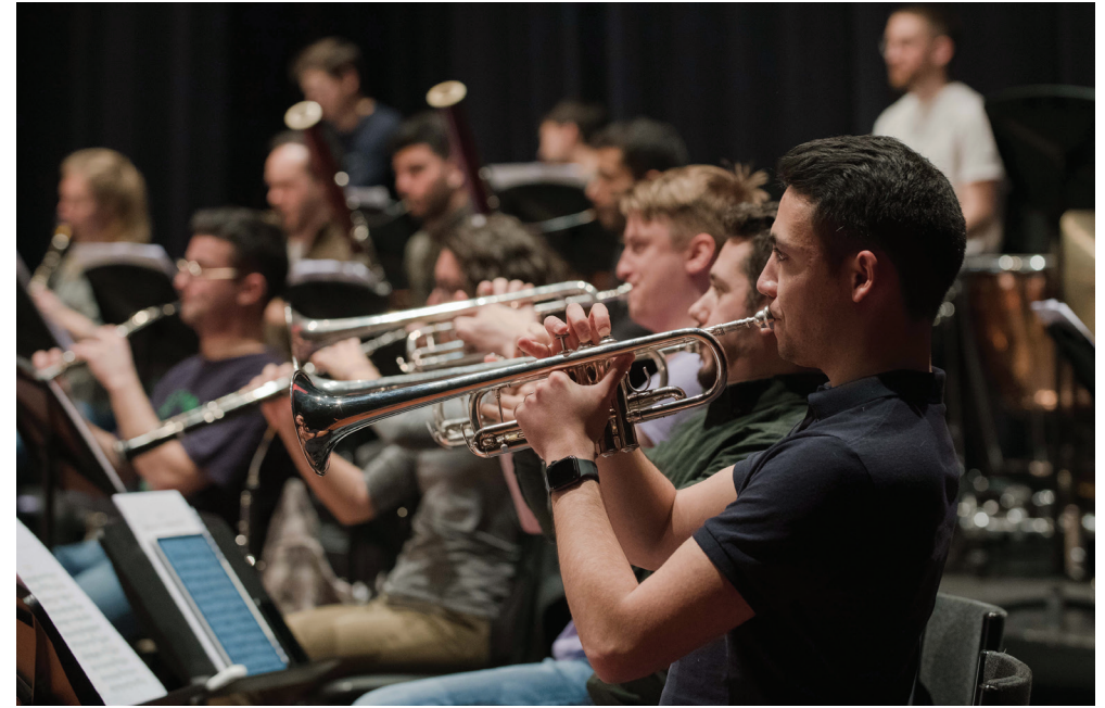
NJO repetitie