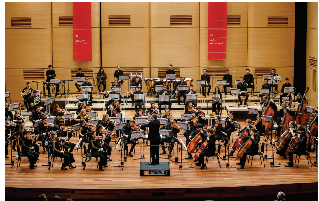
NJO concert