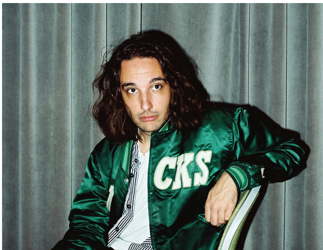
Jameszoo © Catherine Lemblé