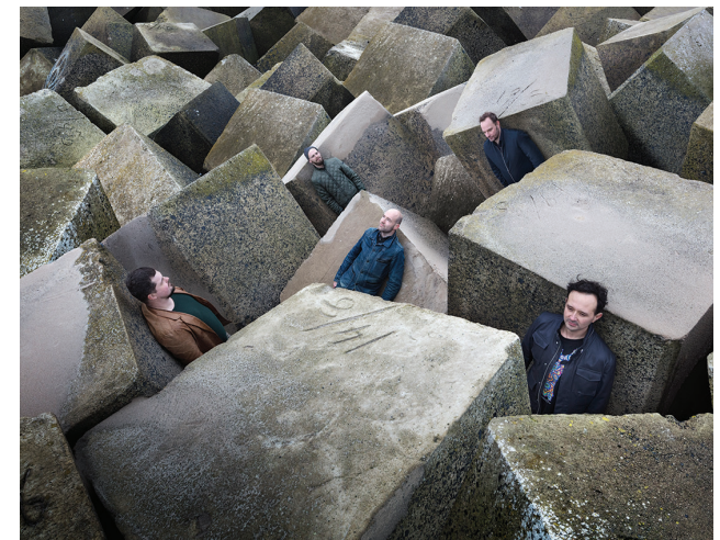
Slagwerk Den Haag