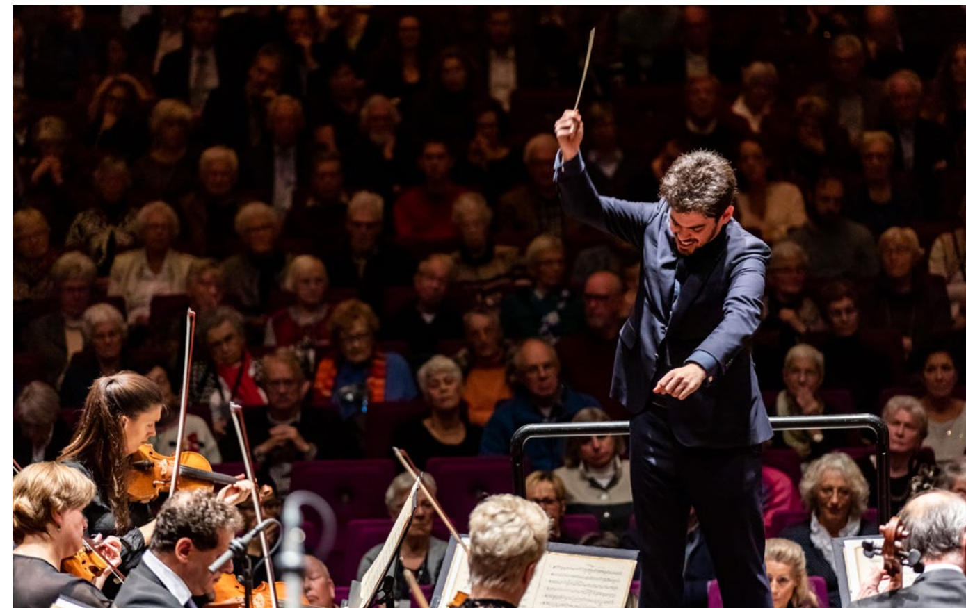
Lahav Shani