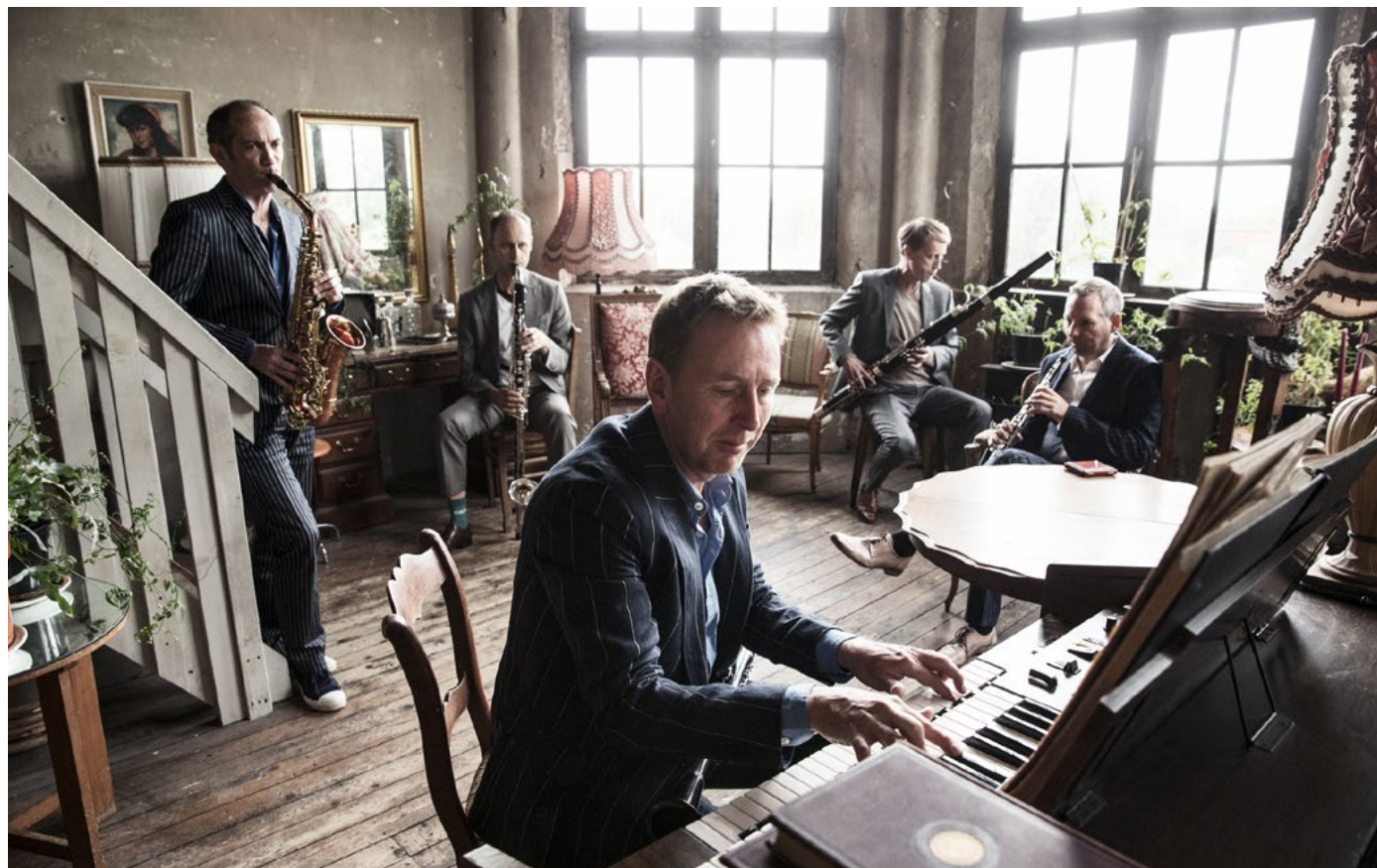
Calefax © Jochem Sanders