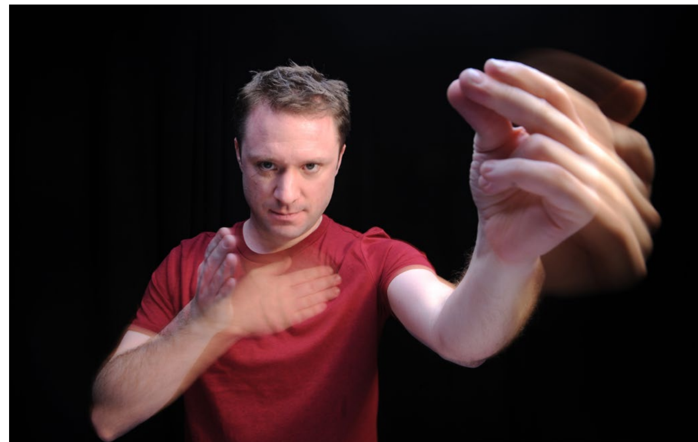
Colin Currie