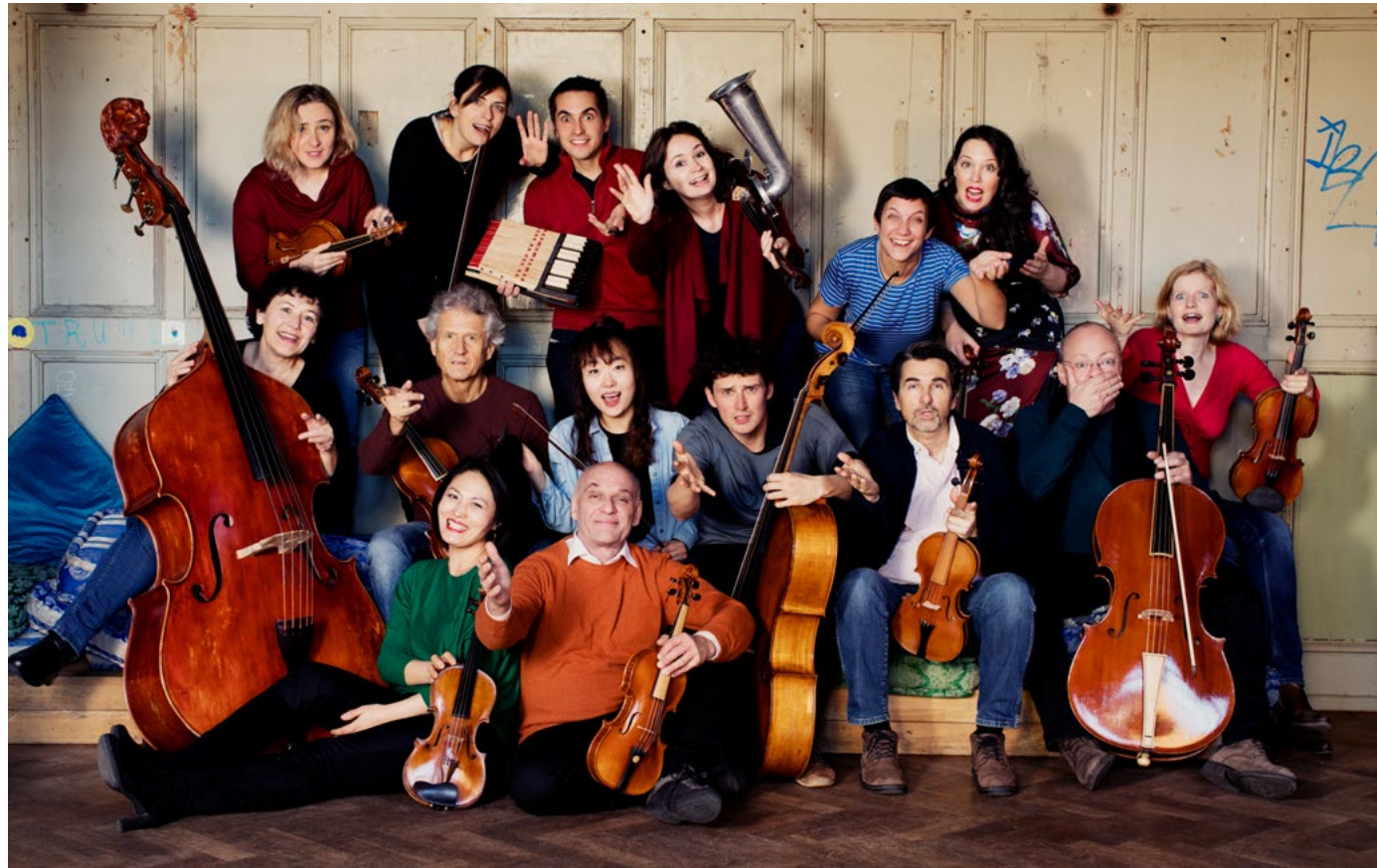
Camerata Bern