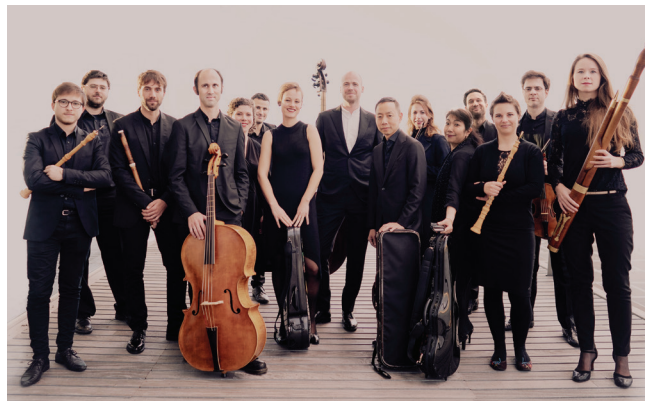
PRJCT Amsterdam